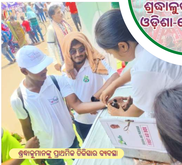
ଶ୍ରୀବାଳୁମାନଙ୍କୁ ପ୍ରାଥମିକ ଚିକିତ୍ସାର ବ୍ୟବସ୍ଥା

ପୁରୀ ରଥଯାତ୍ରାରେ ଶ୍ରୀବାଳୁଙ୍କ ସେବାରେ ଓଡ଼ିଶା-ମୋ ପରିବାର