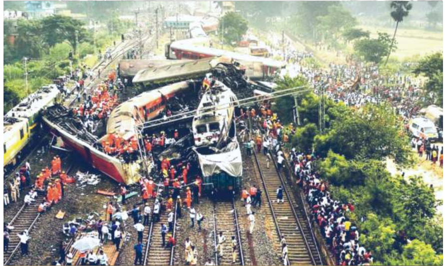
ବାହାନଗାର ଭୟାନକ ରେଳ ଦୁର୍ଘଟଣାରେ ପ୍ରାଣ ହରାଇଥିବା ମୃତକଙ୍କ ଅମର ଆତ୍ମାର ସଦ୍-ଗତି କାମନା କରୁଛି ଓଡ଼ିଶା-ମୋ ପରିବାର