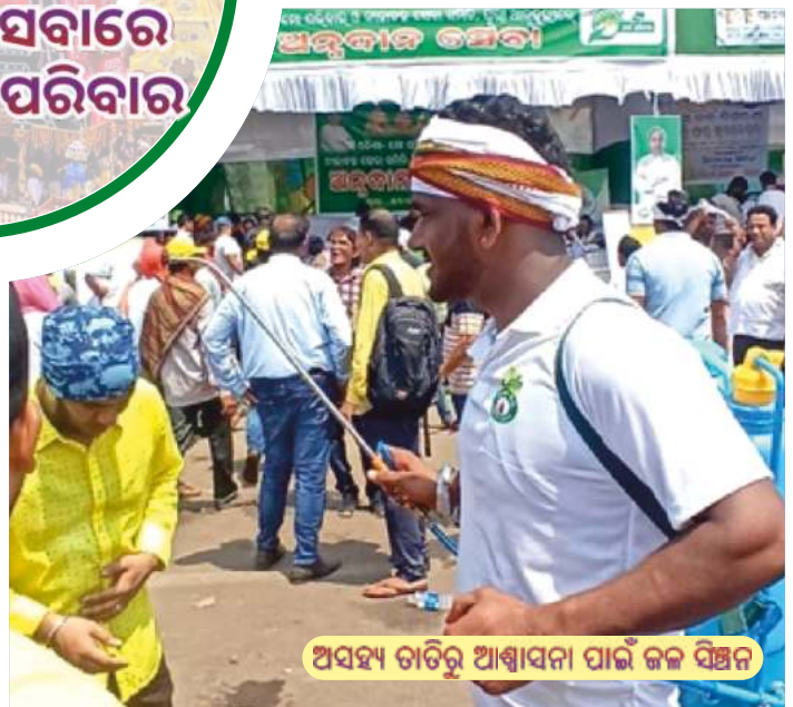
ଅସହ୍ୟ ଗତିରୁ ଆଶ୍ୱାସନା ପାଇଁ ଜଳ ବିତ୍ତନ