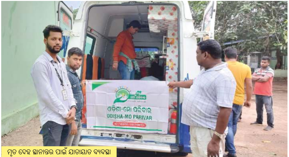
ମୃତ ଦେହ ସ୍ଥାନାନ୍ତର ପାଇଁ ଯାତାଯାତ ବ୍ୟବସ୍ଥା