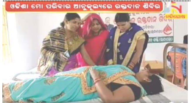
ତାପସକୁ ମିଳିଲା ନୂଆ ଜୀବନ