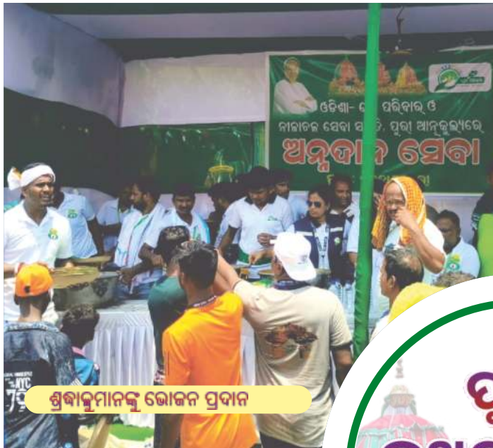
ଶ୍ରୀବାଳୁମାନଙ୍କୁ ଭୋଜନ ପ୍ରଦାନ