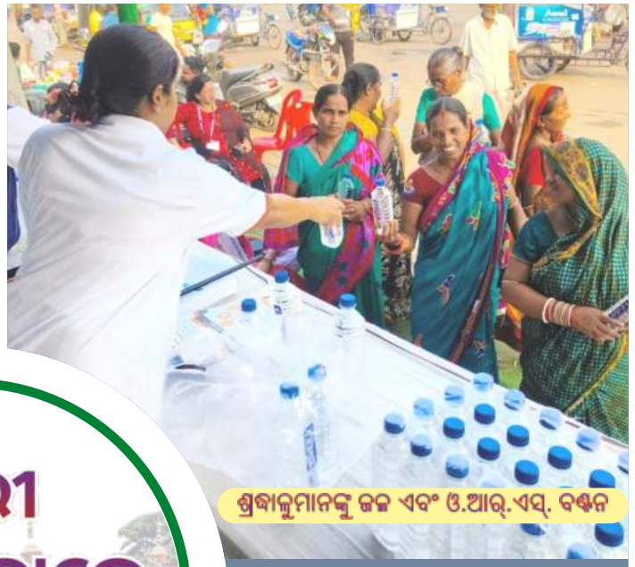
ଶ୍ରୀବାଳୁମାନଙ୍କୁ ଜଳ ଏବଂ ଓ.ଆର୍.ଏସ୍. ବଣ୍ଟନ

ପୁରୀ ରଥଯାତ୍ରାରେ ଶ୍ରୀବାଳୁଙ୍କ ସେବାରେ ଓଡ଼ିଶା-ମୋ ପରିବାର