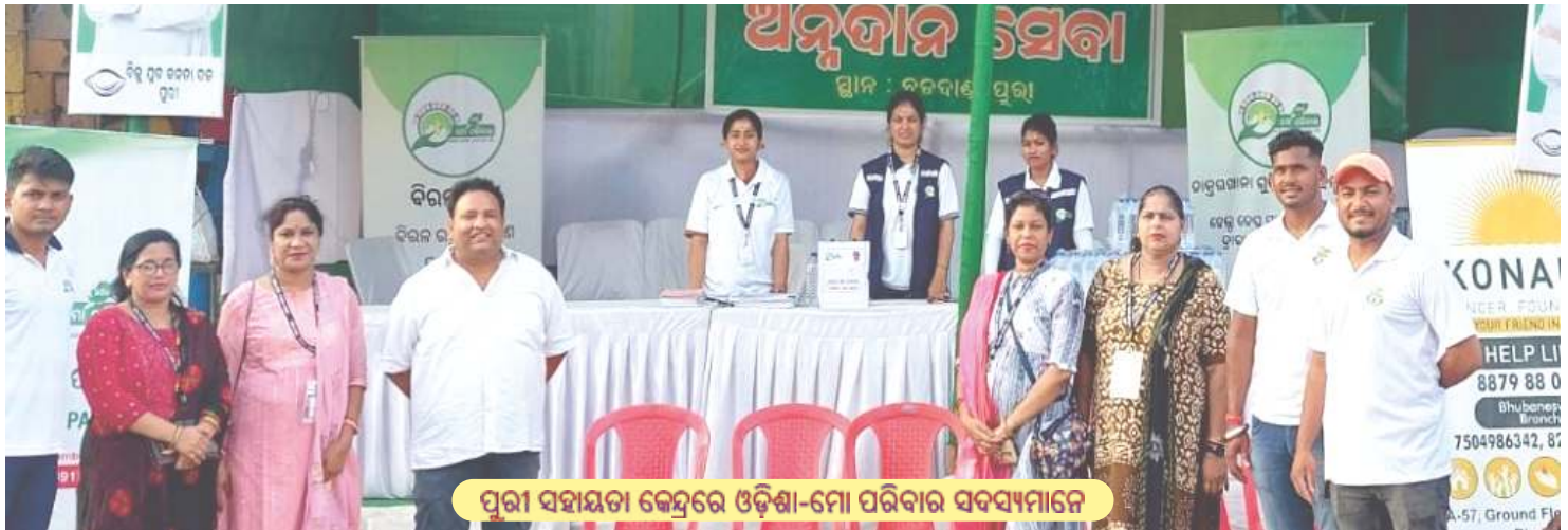
ପୁରୀ ସହାୟତା କେନ୍ଦ୍ରରେ ଓଡ଼ିଶା-ମୋ ପରିବାର ସହସମ୍ପାମାନେ