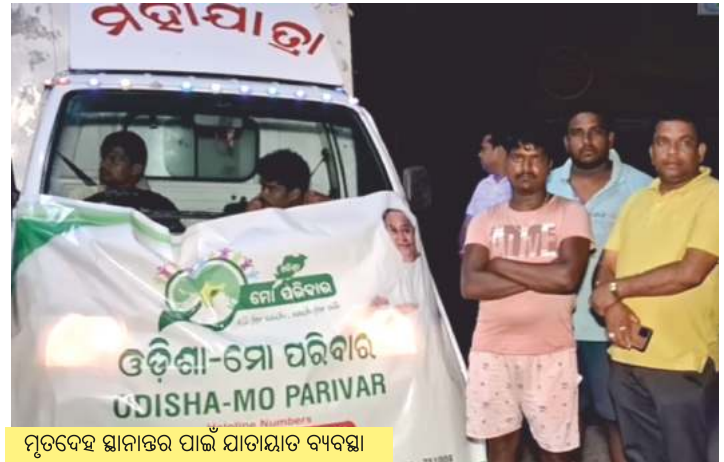
ମୃତଦେହ ସ୍ଥାନାନ୍ତର ପାଇଁ ଯାତାୟାତ ବ୍ୟବସ୍ଥା

ଘଟଣା ସମ୍ପର୍କରେ ସୂଚନା ପାଇବା ପରେ ଓଡ଼ିଶା-ମୋ ପରିବାର ଟିମ୍ ତାଙ୍କରଖାନାରେ ପହଞ୍ଚି ମୃତଦେହକୁ ତାଙ୍କରଖାନାରୁ ଗଞ୍ଜାମସ୍ଥିତ ନିଜ ଗ୍ରାମକୁ ସ୍ଥାନାନ୍ତର କରିବା ପାଇଁ ଆବଶ୍ୟକୀୟ ବ୍ୟବସ୍ଥା କରିଥିଲା ।