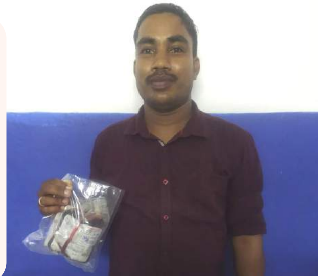
ହସ୍ପିଟାଲରେ ରୋଗୀଙ୍କ ମାମୁଁଙ୍କୁ ରକ୍ତ ହସ୍ତାନ୍ତର କରାଯାଉଛି

ଓଡ଼ିଶା-ମୋ ପରିବାର ହେଲ୍ପଡେସ୍କ ସହଯୋଗୀ ବିଶ୍ୱ ରୋଗୀଙ୍କ ପାଖରେ ଉପସ୍ଥିତ ରହି ଚିକିତ୍ସା ସମୟରେ ଆବଶ୍ୟକୀୟ ସହାୟତା ଯୋଗାଇ ଦେଇଥିଲେ । ଅସ୍ତ୍ରୋପଚାର ସମୟରେ ବିରଳ AB + ve ରକ୍ତର ଆବଶ୍ୟକତା ଥିଲା ଯାହା ପରିବାରବର୍ଗ ଯୋଗାଡ଼ କରିପାରିନଥିଲେ । ଓଡ଼ିଶା-ମୋ ପରିବାର ହେଲ୍ପଡେସ୍କ ସହଯୋଗୀ ବିଶ୍ୱ ଘଟଣା ସମ୍ପର୍କରେ ଜାଣିବା ପରେ ପରିବାରବର୍ଗଙ୍କୁ ଅସ୍ତ୍ରୋପଚାର ସମୟରେ ରକ୍ତ ଯୋଗାଡ଼ କରି ଦେଇଥିଲେ ।