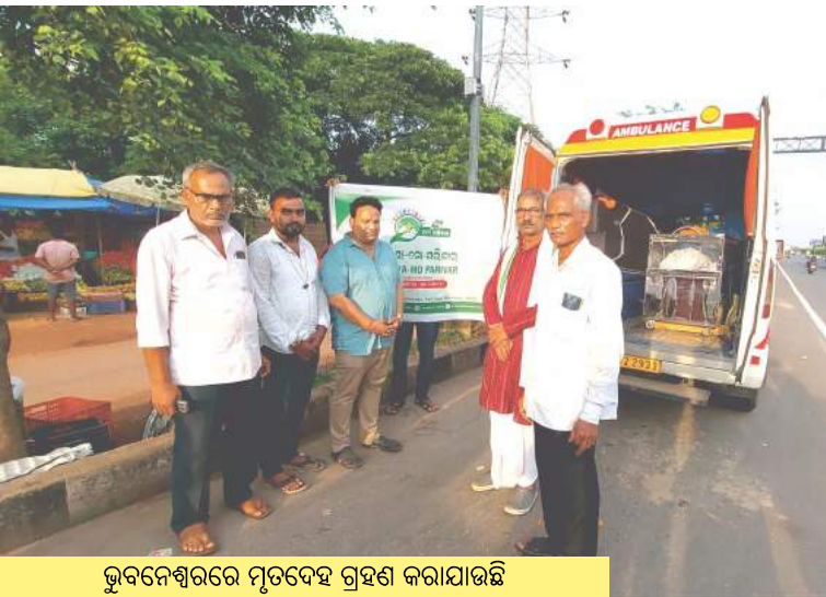
ଭୁବନେଶ୍ୱରରେ ମୃତଦେହ ଗ୍ରହଣ କରାଯାଉଛି