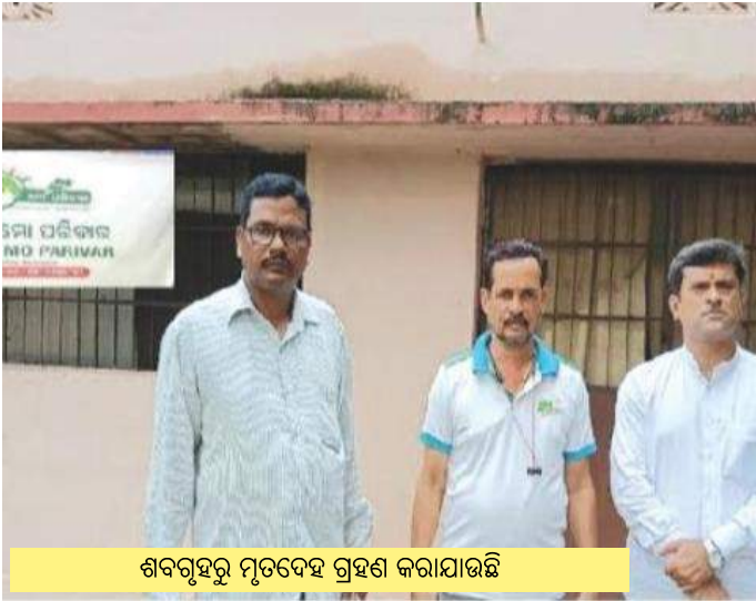
ଶବଗୃହରୁ ମୃତଦେହ ଗ୍ରହଣ କରାଯାଉଛି