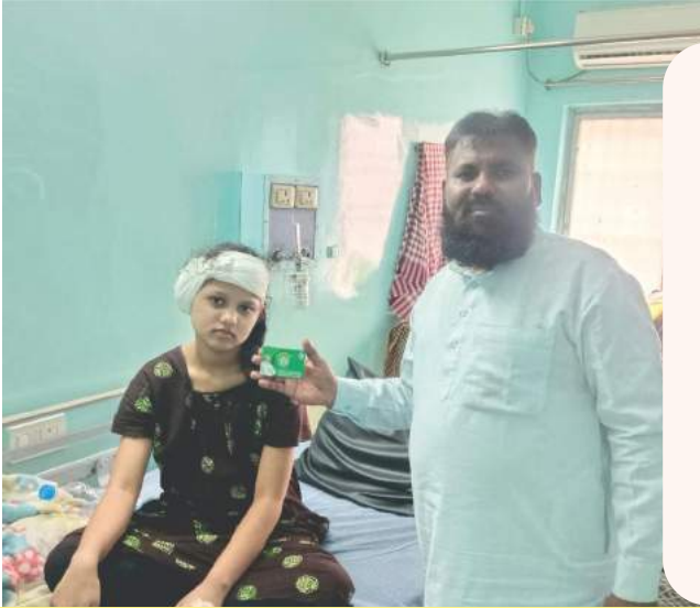
ହସ୍ପିଟାଲରେ ଚିକିତ୍ସାଧୀନ ଅବସ୍ଥାରେ ରୋଗୀ