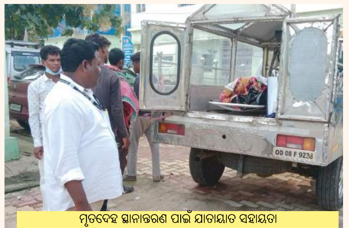
ମୃତଦେହ ସ୍ଥାନାନ୍ତରଣ ପାଇଁ ଯାତାୟାତ ସହାୟତା

ହୋଇଥିଲେ ଏବଂ ସେମାନଙ୍କୁ ହସ୍ପିଟାଲର ଆବଶ୍ୟକୀୟ ପ୍ରକ୍ରିୟାରେ ସାହାଯ୍ୟ କରିବା ସହିତ ପରିବାରବର୍ଗଙ୍କୁ ହସ୍ପିଟାଲରୁ ସେମାନଙ୍କ ବାସଭବନକୁ ସ୍ଥାନାନ୍ତର କରିବା ପାଇଁ ଯାତାୟାତ ବ୍ୟବସ୍ଥା କରିଥିଲେ ।