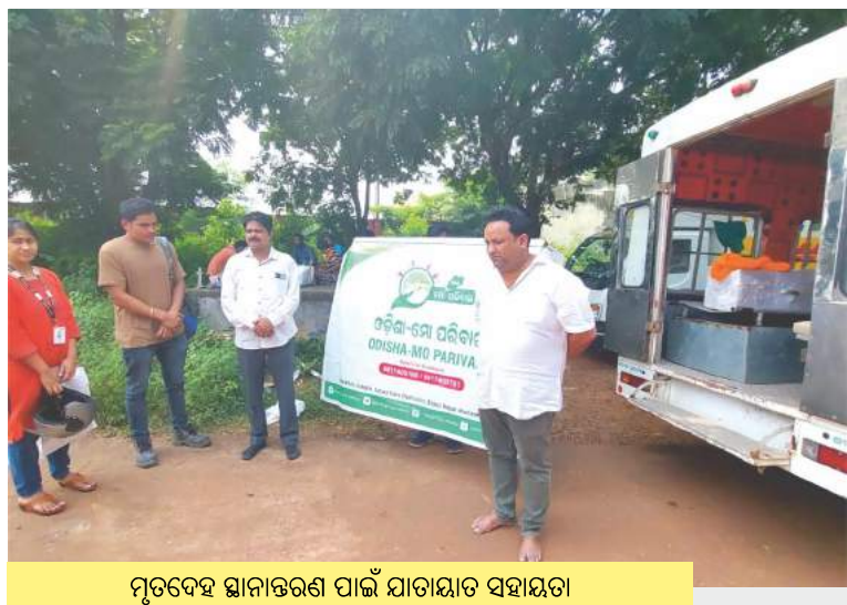
ମୃତଦେହ ସ୍ଥାନାନ୍ତରଣ ପାଇଁ ଯାତାୟାତ ସହାୟତା

ଉପଯୁକ୍ତ ସମୟରେ ଓଡ଼ିଶା-ମୋ ପରିବାର ନାରାୟଣ ଏବଂ ତାଙ୍କ ପରିବାର ସଦସ୍ୟଙ୍କ ସହିତ ଛିଡ଼ା ହୋଇଥିବାରୁ ସେମାନେ ଏଥିପାଇଁ ମାନ୍ୟବର ମୁଖ୍ୟମନ୍ତ୍ରୀ ଏବଂ ଓଡ଼ିଶା-ମୋ ପରିବାରକୁ ଅଶେଷ ଧନ୍ୟବାଦ ଜଣାଇଥିଲେ ।