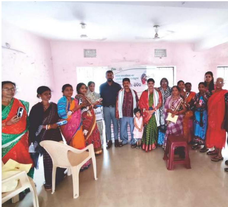
ହିତାଧିକାରୀଙ୍କୁ ଚକ୍ଷୁମା ବଣ୍ଟନ କରାଯାଇଛି