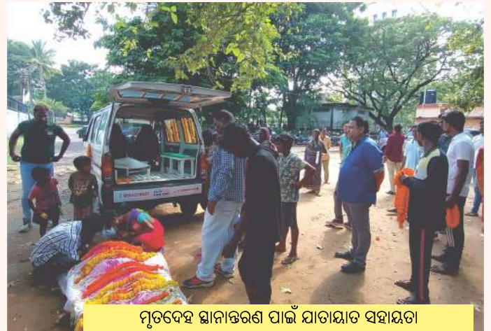
ମୃତଦେହ ସ୍ଥାନାନ୍ତରଣ ପାଇଁ ଯାତାୟାତ ସହାୟତା