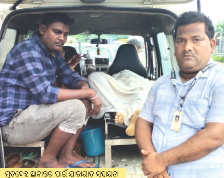
ମୃତଦେହ ସ୍ଥାନାନ୍ତର ପାଇଁ ଯାତାୟାତ ସହାୟତା