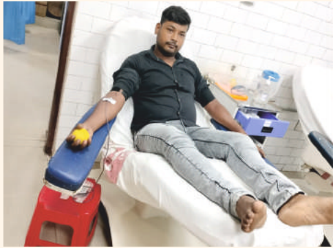
କ୍ୟାପିଟାଲ ହସ୍ପିଟାଲରେ ଜଣେ ଡେଜୁ ରୋଗୀଙ୍କ ପାଇଁ ଜ୍ୟୋତିଙ୍କ ଦ୍ୱାରା ରକ୍ତଦାତା ଯୋଗାଡ଼